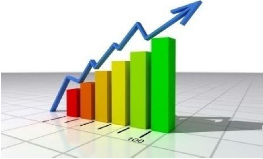
2019-2023 Stratejik Planı Faaliyet/Proje Maliyetlendirme Tablosu